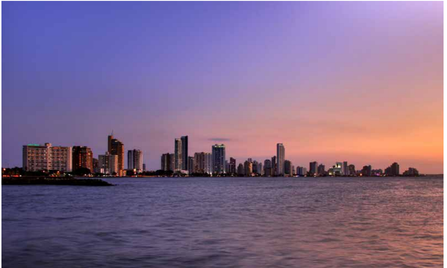
Cartagena bañada por el mar caribe.

Enmarcada por una hermosa bahía, Cartagena de Indias es una de las ciudades más bellas y mejor conservadas de América; un tesoro que,