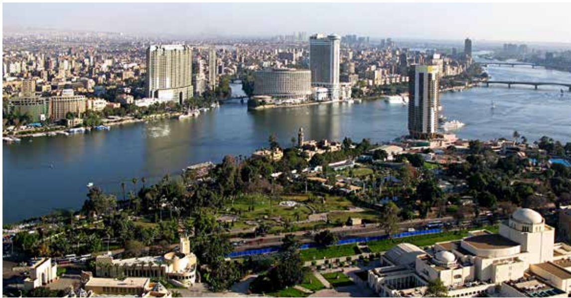
El río Nilo a su paso por El Cairo.

Pero existen muchos más conjuntos arqueológicos de igual interés y menor popularidad que