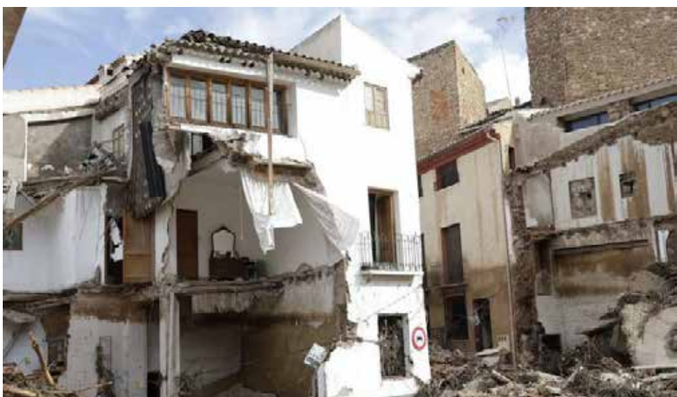
Estado de las viviendas afectadas por el fenómeno noctual