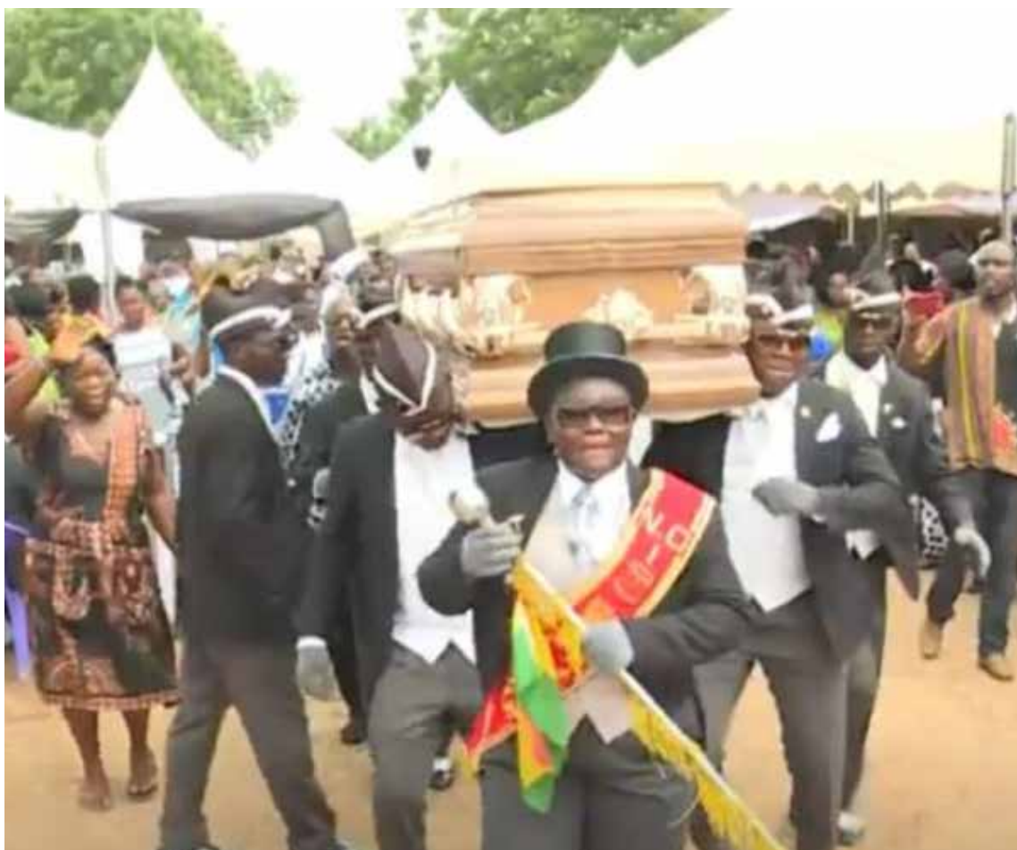
Cuando medio mundo se encuentra confinado por la pandemia de coronavirus, en las redes sociales se ha hecho popular un meme protagonizado por estos bailarines.

En las últimas semanas, cuando medio mundo se encuentra confinado por la pandemia de coronavirus, en las redes socia-