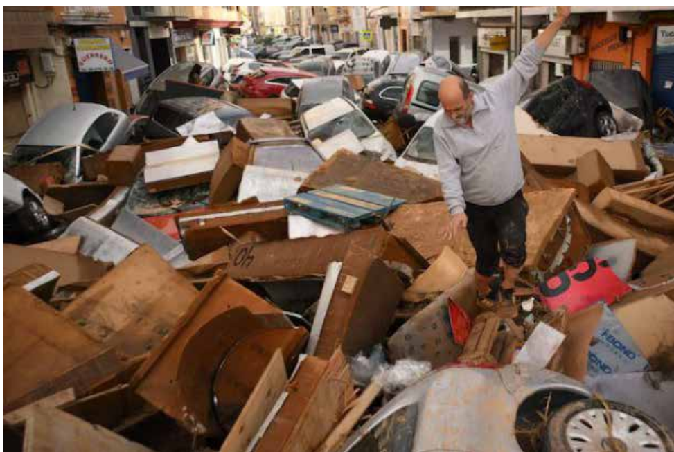
Un ciudadano español debe hacer malabares para transitar por las calles.