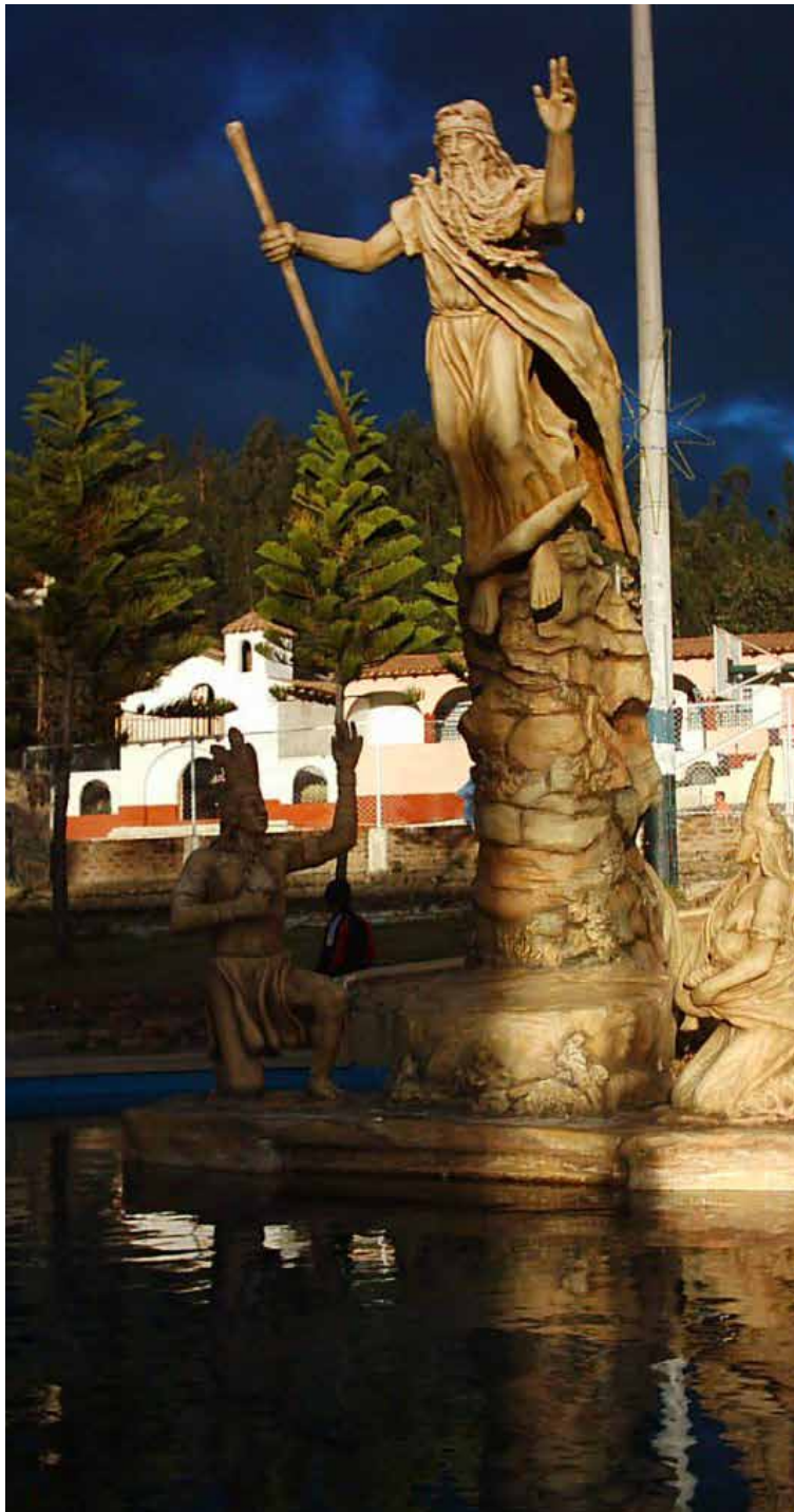
Bochica el dios de los muisca

El vocablo Indoamérica corresponde a la trayectoria consuetudinaria e integral de las primeras naciones ancestrales. Comprende lo indio, lo ibérico, lo latino, lo negro, lo mestizo y un proceso notable por su energía y actividad en permanente desarrollo y evolución, intensificando su dinamismo