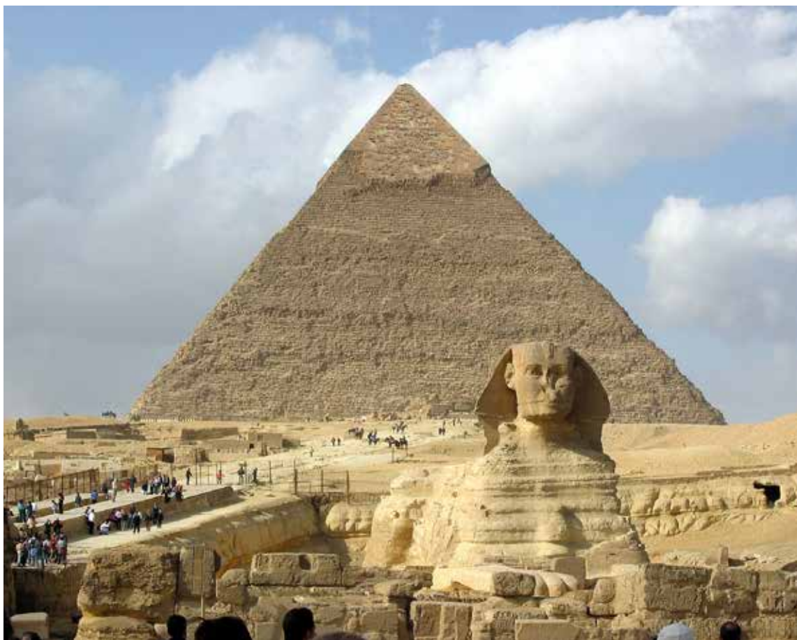
La esfinge y las pirámides de Guizga construidas durante el imperio antiguo de Egipto.

En Egipto se puede, además, disfrutar de una gastronomía basada en una concepción de cocina egipcio-turca en la que destacan como platos autóctonos el fowl (puré de judías o lentejas), tahina (pasta de sésamo), koushari (arroz, macarrones, lentejas y garbanzos con salsa picante) y el babaganoush (pasta de berenjenas), sin olvidarse de las diversas expresiones del kebab (kofta, shawarma, shish kebab, entre otros), ni de platos recreados según viejas recetas de los tiempos de los faraones, como oca asada o pato