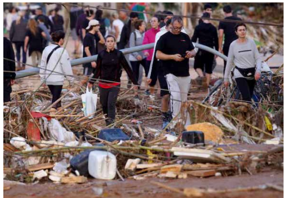
Vista de una calle afectada en Paiporta, tras las fuertes lluvias causadas por la dana, este miércoles.