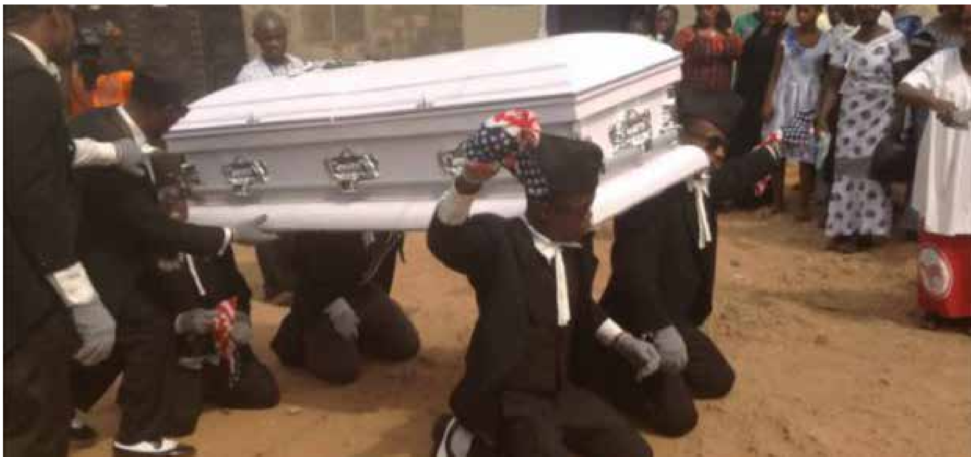
Los ataúdes son levantados al ritmo de la música por un grupo de bailarines que realizan una coreografía antes del entierro.

E n Ghana, en África Occidental, los entierros empiezan a celebrarse de una manera distinta.