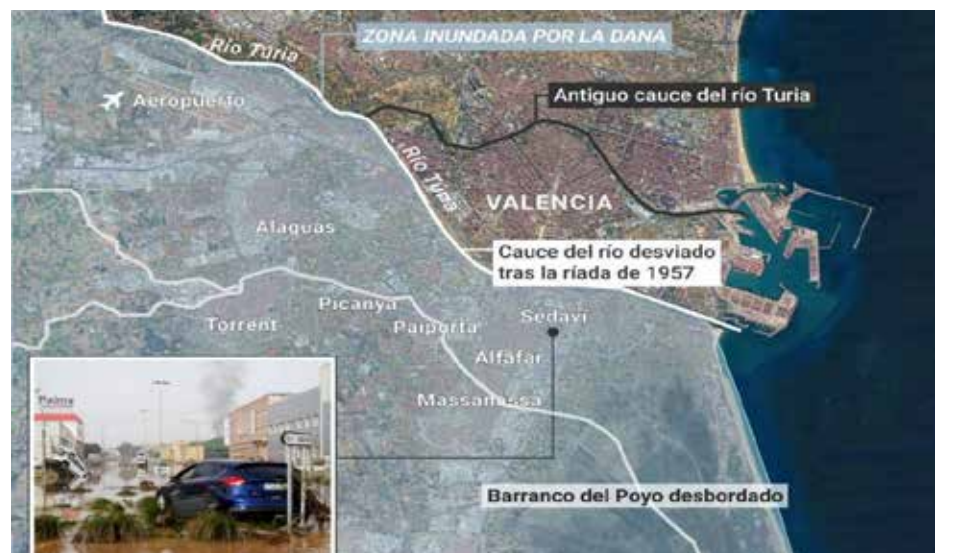
La DANA causó estragos en el este y sur de España, dejando inundaciones, desbordamientos y miles de personas afectadas en varios pueblos.