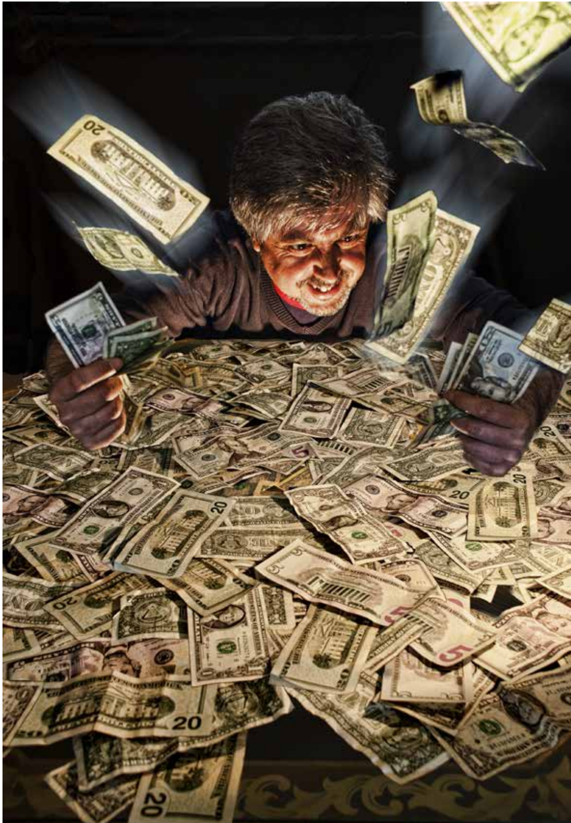
El dinero se gasta por montones