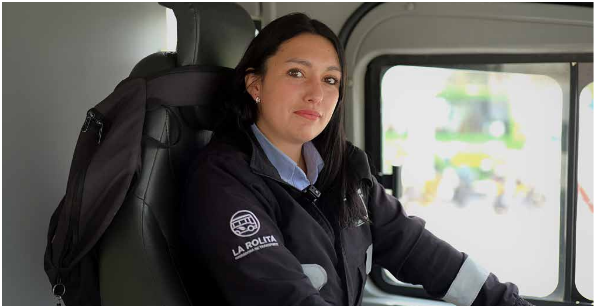
La Rolita la empresa que debe volverse a hacer.

La Rolita cuenta con una flota de 195 buses 100% eléctricos y brinda empleo de calidad a cerca de 800 personas, de las cuales 60% son mujeres.