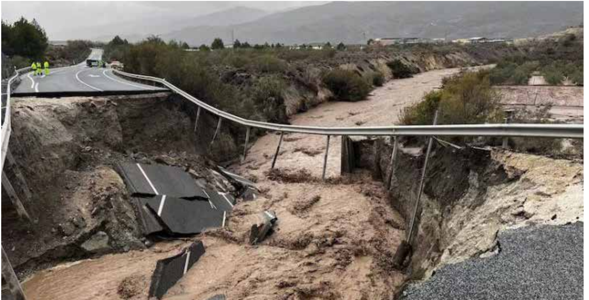
Estado de la carretera y un puente.